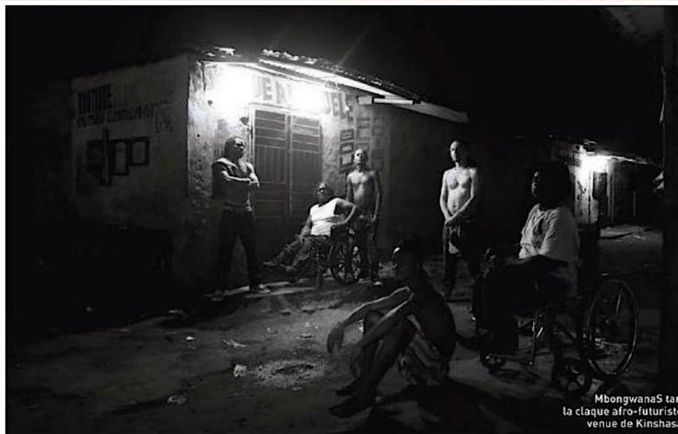
MbongwanaS tar, la claqué afro-futuriste venue de Kinshasa